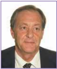
Lluís Roig i Ayza 1r Tinent d'Alcalde